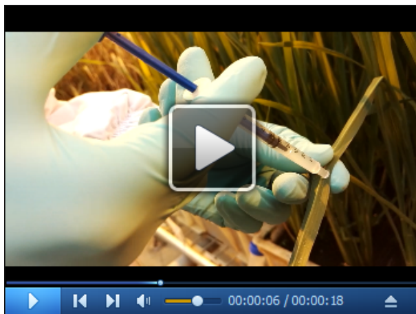
视频 1. 渗透法接种水稻细菌性条斑病