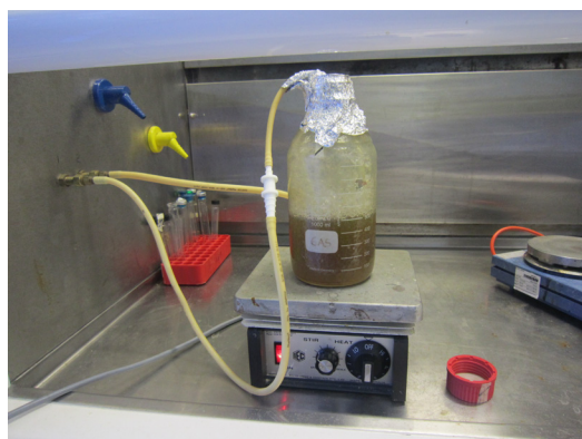
图 1. 二氧化碳通气中